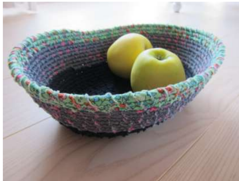
Løbbinding med stof og symaskine

Teknikken er gennem de seneste år blevet udviklet og fornyet af danske kunsthåndværkere, med nye materialer og nye funktioner.