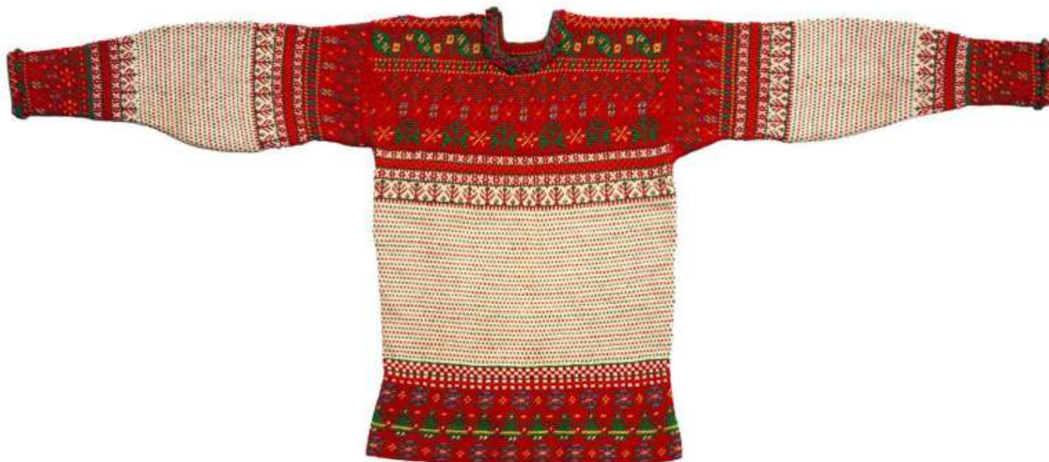
Korsnäströja för barn, Österbottens museum, Vasa, Finland