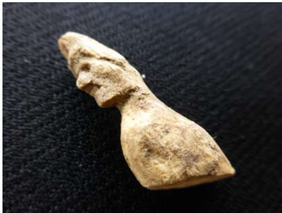
Gamle figurer af koljeben