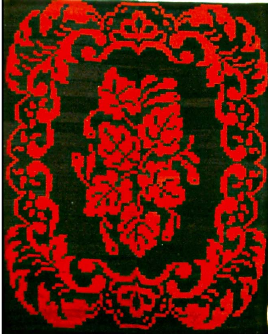
Åkle i rutevev fra Vest-Agder.