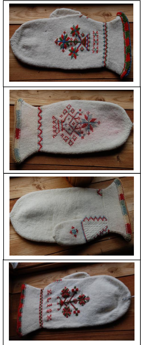
Et utvalg av tradisjonelle votter fra Sunndal

Noen av vottene på Leikvin hadde betegnelsen «bryllaupsvott» eller «kyrkjevott,» og de hadde lite slitasje. Mest sannsynlig var vottene stasplagg som bare ble brukt til fest og høytid. Vi valgt å kalle votten vår for Stasvott fra Sunndal.