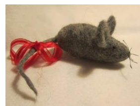
Småstrikk – kanskje noen ideer til neste års «Katta i sekken» ?