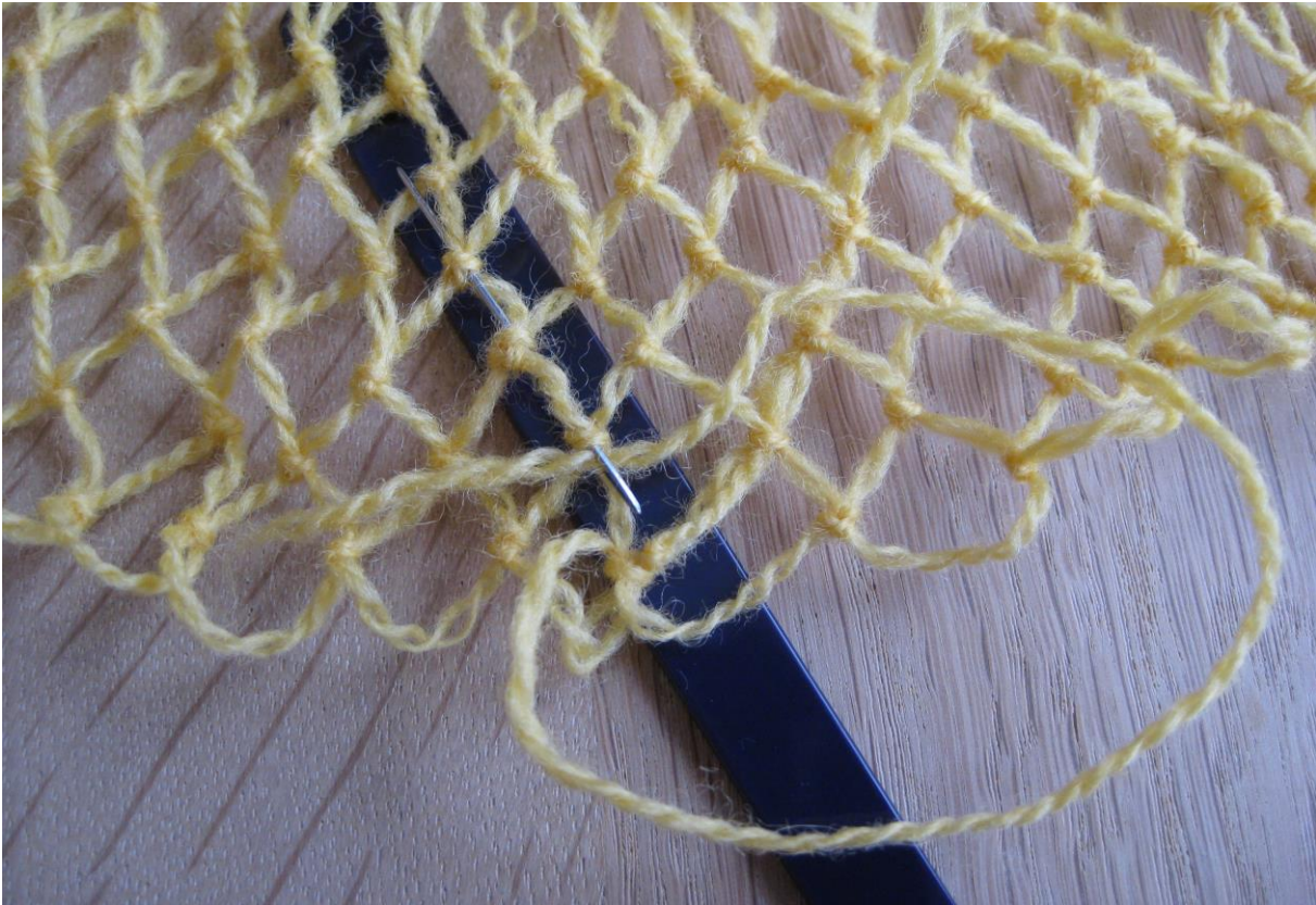
Tråd nr to: nålen er klar til å trekkes gjennom tre nettknuter.