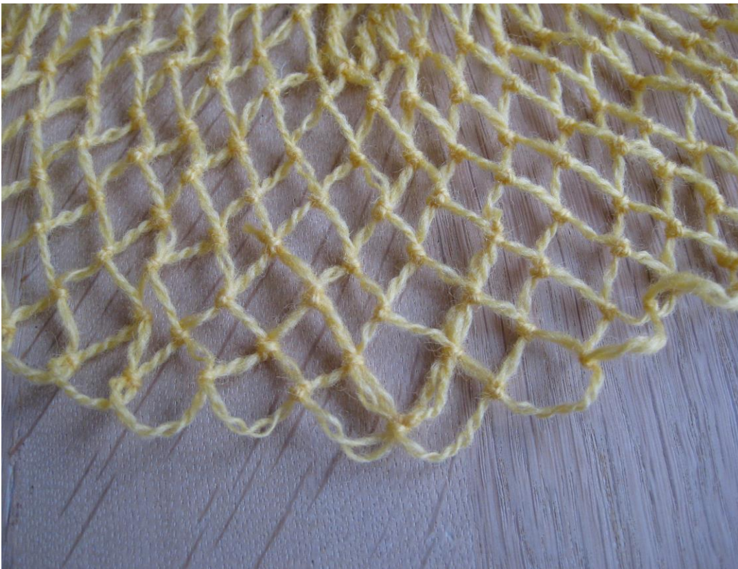
Begge trådene er festet.