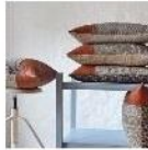
Varp & Veft