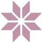
Kroken Gård Og Hestesenter Thengs