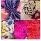
AL VI by Janicke