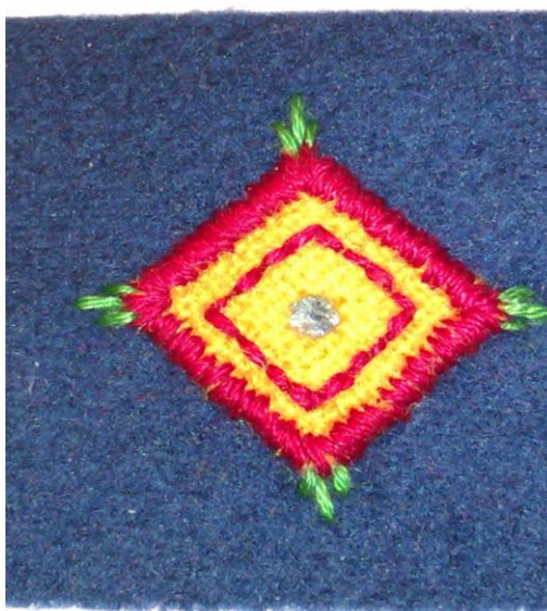
Kråkesølvbroderi for butikkansatte

Har startet planlegging av seminar våren 2012 i samarbeid med Midt-Troms Museum.