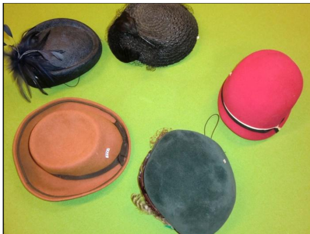
Hatter fra Westgaars-samlinga

Malangen. På Bardufoss fikk elever fra Høgtun vg skole, Design og tekstil, orientering om registreringsarbeidet.