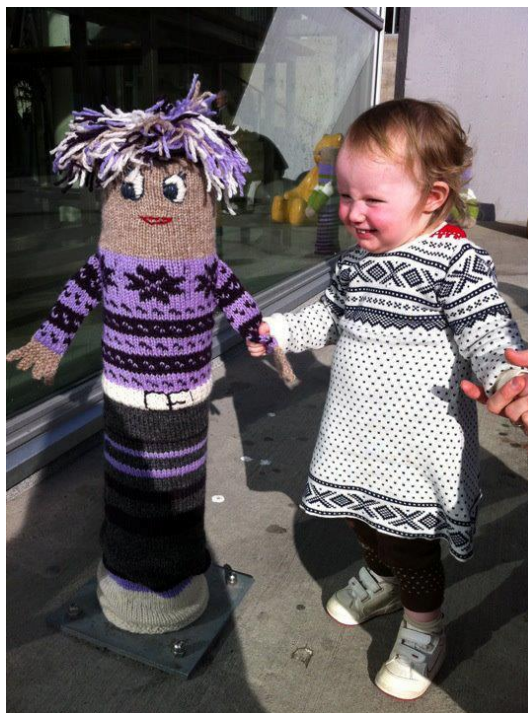
Alle betongsøylene utenfor biblioteket var forvandlet til småfolk!