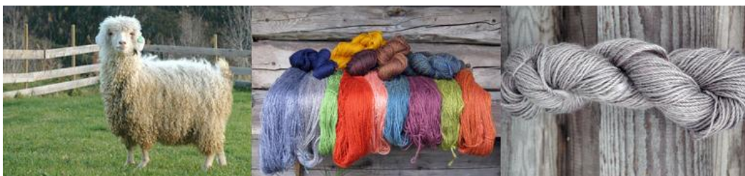
Mohairgeit og garn fra Telemarks eget spinneri: Telespinn AS i Svartdal.