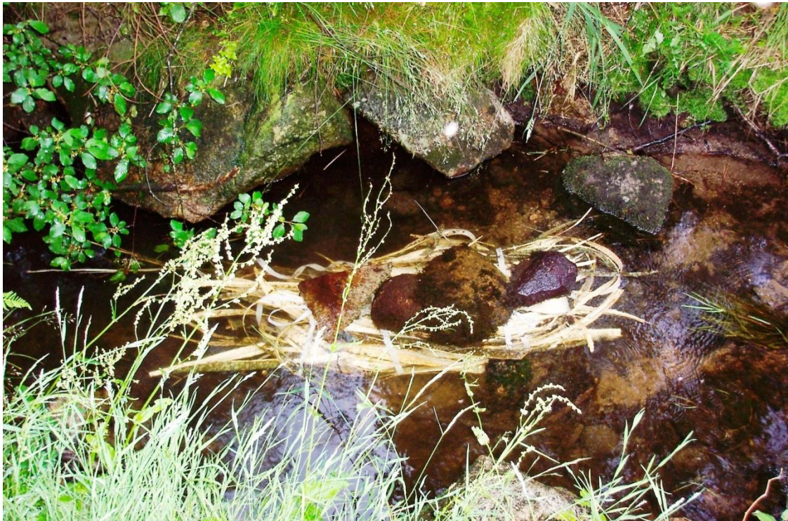
Lindebark lagt i en bekk for røyting.