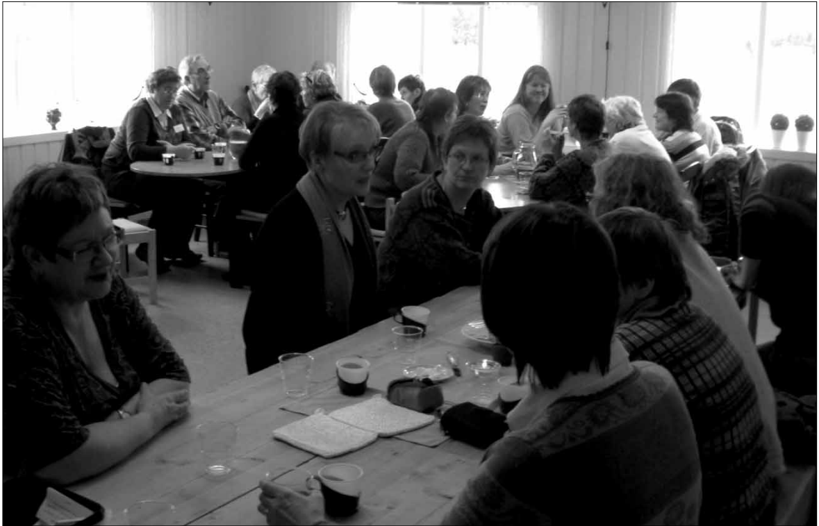
Deltakarane fekk god bevertning under vitjinga på Stadlandet.