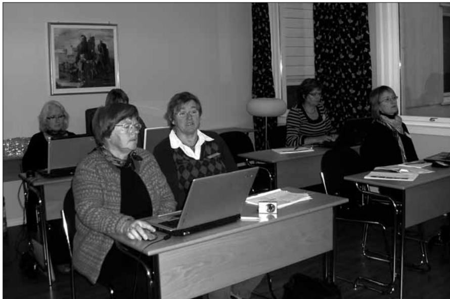
Ivrige Web-studentar: No skal det bli fart over heimesidene! Deltakarane var lærevillige og positive.

24. – 25. oktober var det dukka for medarbeidersamling på Bryggen Hotel, Eid. Totalt 33 personar deltok på samlinga, som i følge evalueringa svara til forventningane og vel så det for flesteparten av deltakarane. WEB-gruppa møtte beklagelegvis på ein ubehageleg situasjon: nettsambandet på hotellet hadde vorte råka av lynvarme.