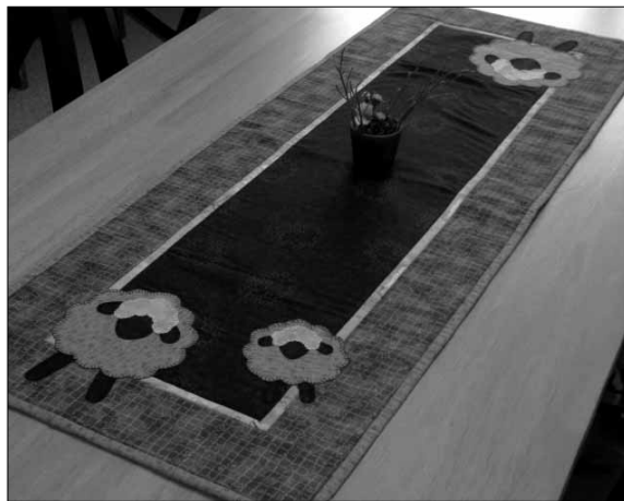
Nydeleg løpar – frå utstillinga i lagslokalet til vertsskapslaget.

Årsmøtesamlinga 7. – 9. mars i Selje var ein suksess- og ei flott oppleving å få med seg. Vertskapslaget Kjerringa Husflidslag diska opp med ein strålende programmeny, som inneheldt alt frå synfaring og lunsj i aktivitetshuset deira på Stadlandet til praktisk aktivitet og flott song og pianospel av born og unge.