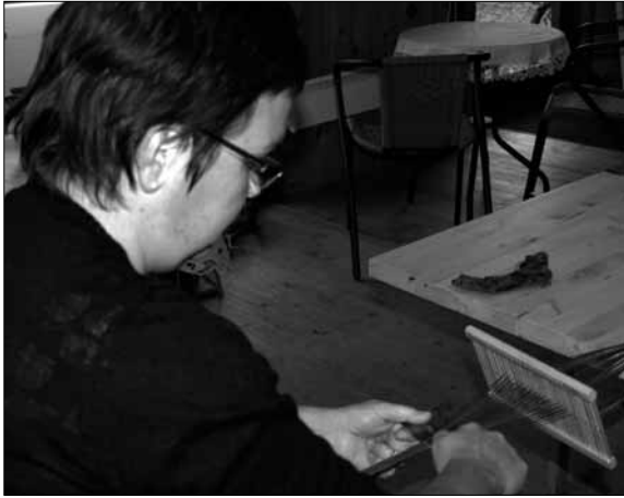
Kurs i bandvev og brikkevev vart ein suksess.

Florø Husflidslag går i 2009 inn i sitt 70. år. Då er det veldig kjekt å sjå at det er god aktivitet i alle undergruppene i laget. "Ung Husflid" starta opp med 30 ungar i haust, og fleire står på venteliste. Så dette er noko som er kjekt å drive med, samstundes som det er kjekt å føre vidare og lære bort gamle handverksteknikkar til den yngre garde. Det er jo ungene som er framtida - - også for husflidssektoren.