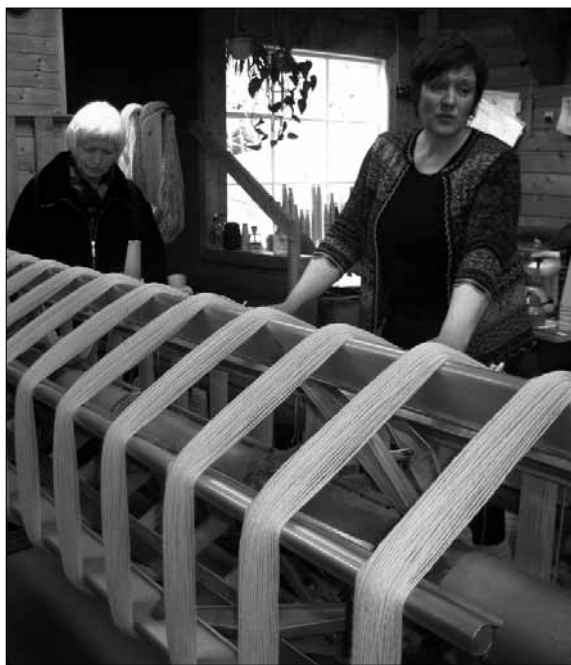
Omvisning på Hillesvåg Ullvarefabrikk.