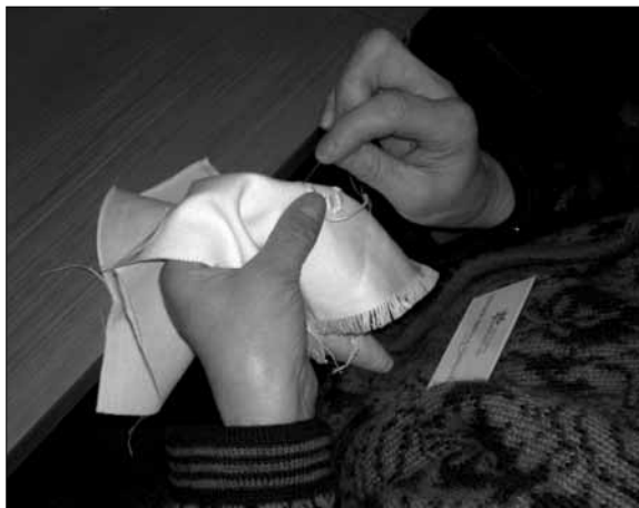
Åtte deltakarar fordjupa seg i hardangersaum.