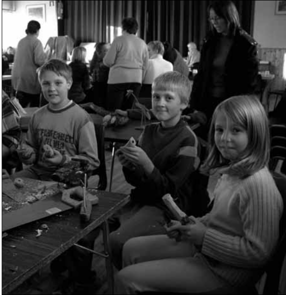
Spikking har vore ein populær aktivitet for borna i Ytre Gulen.