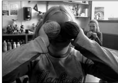
Litt gøy må ein ha...innimellom.