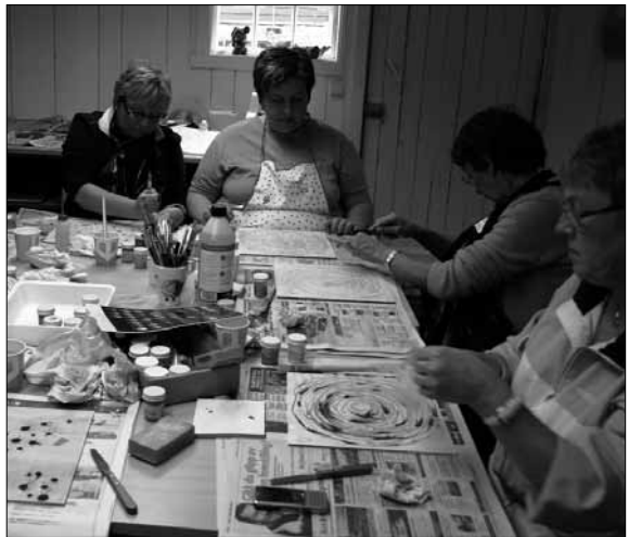
Husflidsdamene i Lærdal har det sosialt og fint ilag.

1. juni var vi på strikkekafe og fotballkamp på Fossaugane i Sogndal. Vi vart inviterte sidan vi hadde vore med å sørgje for at Sogndal vann kampen mot Brann om lengste supporter-skjerfet. I sommar har Vennskap Jeriko-Lærdal drive Jerikobui på laurdagane i Eldhuset, og her har også vore varer frå husflidslagsmedlemmene for sal.