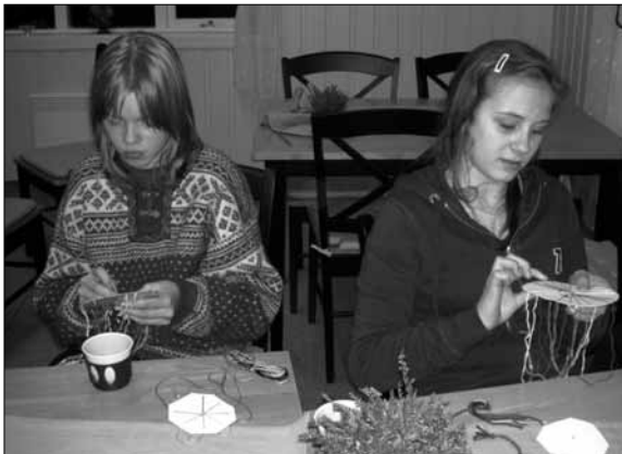
...ivrige born: Nøyaktig må ein vere...!