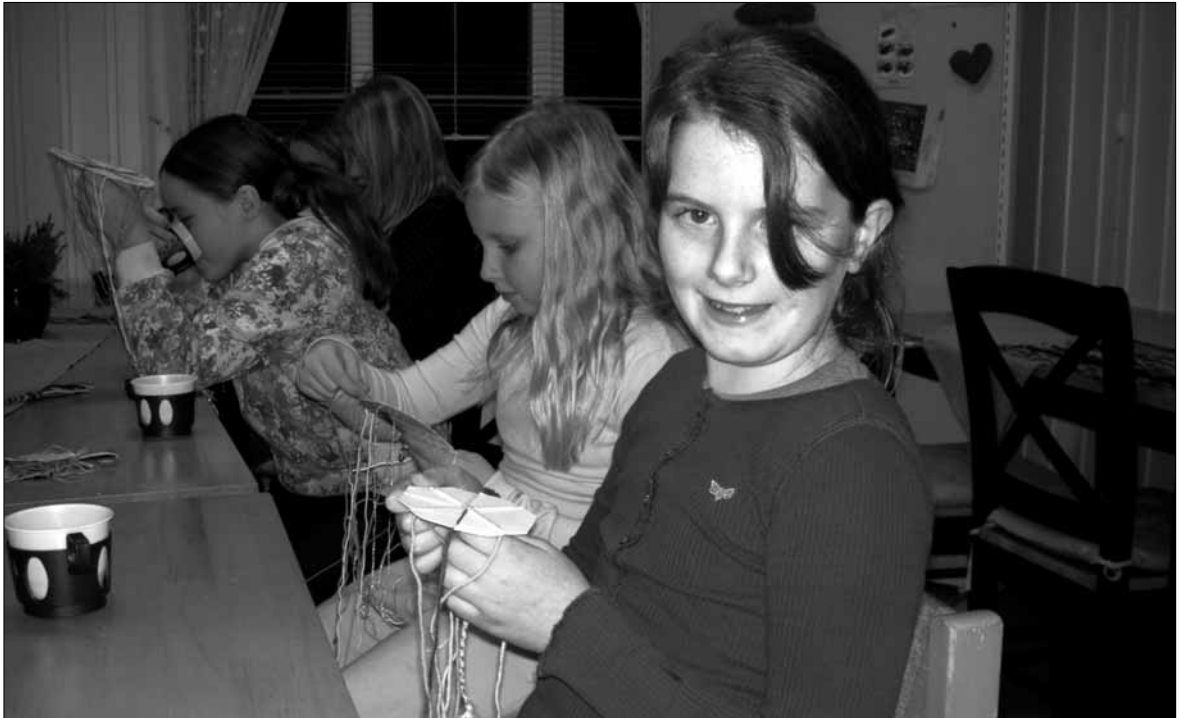
Her blir det band i flotte fargar! Ein triveleg aktivitet for borna på Stadlandet.