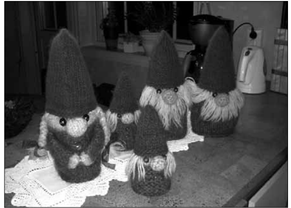
Produkt frå Kjerringa Husflidslag.