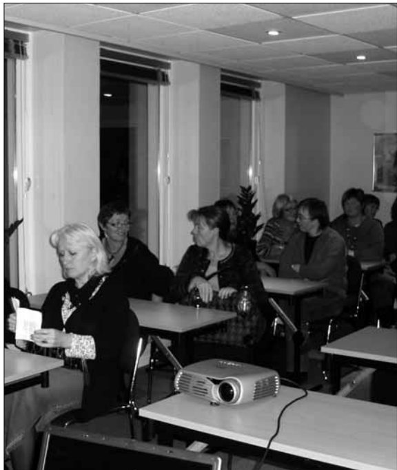
Organisasjonskurset: Forventningsfulle deltakarar klar til dyst.