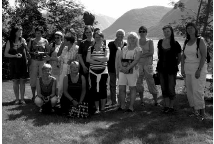
P  tur: Spennande, inspirerende og sosialt.