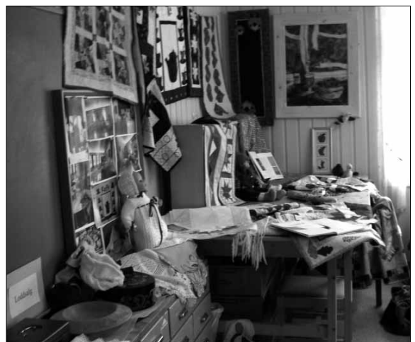
Årsmøte 2008: Frå utstilling hos Kjerringa Husflidslag.