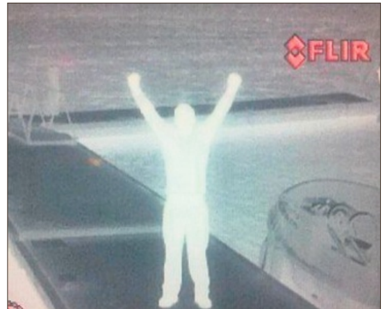
FUNN: Kroppsvarmen lyser i høve til omgjevnadene. Illustrasjon: Redningssselskapet