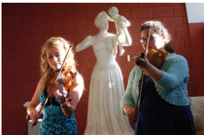
Studentkonsert HiT, våren 2009

Påmeldingsfrist 14.6. Kurs kr 2250,- Opphald og mat kr 1740,-